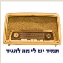
תמיד יש לי מה להגיד