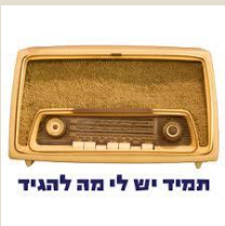
תמיד יש לי מה להגיד